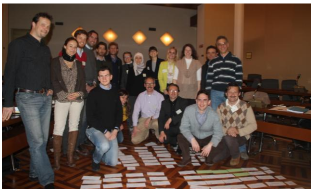
Topošie Passive House Designer and Tradesperson apmācītāji Cesenā

Kvalificēti projektētāji un meistari ir viens no galvenajiem elementiem, lai ieviestu Zema enerģijas patēriņa ēkas plašākā mērogā. PassREg ietvaros esošie kursi Pasīvās Mājas projektētājiem un izplatītājiem, ko iepriekš attīstīja Pasīvās Mājas institūts, šobrīd ir iztulkoti dažādās Eiropas valodās un pielāgoti reģionālajiem klimatiskajiem apstākļiem un būvniecības tradīcijām. Lai nodrošinātu, ka šīs apmācības izplatīsies daudz plašākā mērogā, nevis tikai trīs gadu PassREg projekta ietvaros, nākamie kursu apmācītāji no dažādām ES valstīm tiek apmācīti, lai viņi varētu šos kursus mācīt visā Eiropā.