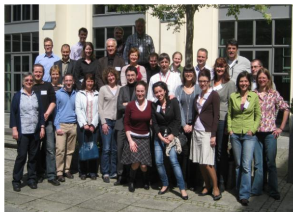
Projekta uzsākšanas tikšanās sapulces dalībnieki

Pēdējie notikumi un jaunākie projekta secinājumi tika apspriesti 17.Starpautiskās Pasīvās Mājas konferencē , kas notika projekta līdera pilsētā Frankfurtē. Frankfurtes vadošā loma energoefektivitātes būvniecības jomā ir neapstrīdama: ar veiksmīgu politisko atbalstu, vairāk kā 1600 dzīvokļu, kā arī vairākas skolas, bērnudārzi un citas ēkas līdz šim ir uzbūvētas saskaņā ar Pasīvās Mājas standartu. Dalībniekiem tika piedāvāti vairāki apmācību braucieni, kur bija iespēja apmeklēt jau pabeigtus un procesā esošus būvniecības un atjaunošanas projektus Frankfurtē un Heidelbergā. Heidelbergā, vēl vienā projekta līderu reģionā, kas atrodas 100km uz dienvidiem no Frankfurtes, atsevišķs pilsētas rajons, kas aptver 116 hektārus, šobrīd tiek izbūvēts saskaņā ar Pasīvās Mājas standartiem.