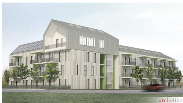
Social Housing Case Finali / studio Archeoffice associate

Cesena pašvaldība šobrīd attīsta sociālās mājas projekta ēku, kas atrodas pie pilsētas dienvidrietumiem, kalna nogāzē. Case Finali ir daudzstāvu ēka ar 25 dzīvokļiem. Ēku projektējusi Archeoffice studio un ēka ietver pārskatītu ballatoio tipoloģiju ar pieeju dzīvokļiem no gara, daļēji privāta balkona. Projekta informācija