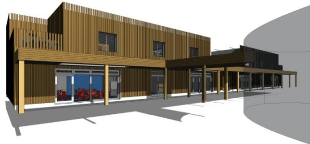
Attēls: Carmarthenshire County Council Atjaunojamo energoresursu attīstība

Burry Port skola (Karmartenšīra, Velsa) šobrīd ir sākotnējā projektēšanas stadijā, plānots, ka tā tiks celta saskaņā ar Pasīvās Mājas standartiem. Iedvesmojoties no citām Pasīvās Mājas skolām, kas uzceltas Apvienotajā Karalistē, Karmartenšīras Padome (pašvaldības klients) šobrīd uzskatāmi vēlas parādīt standartu piemērojamību Velsas skolās, ar mērķi nodrošināt ilgtermiņa ekonomisko izdevīgumu pašvaldībai, kā arī veselīgu vidi skolēniem un skolotājiem, kas vienlaikus veicinātu apmācības procesu. Projekta informācija